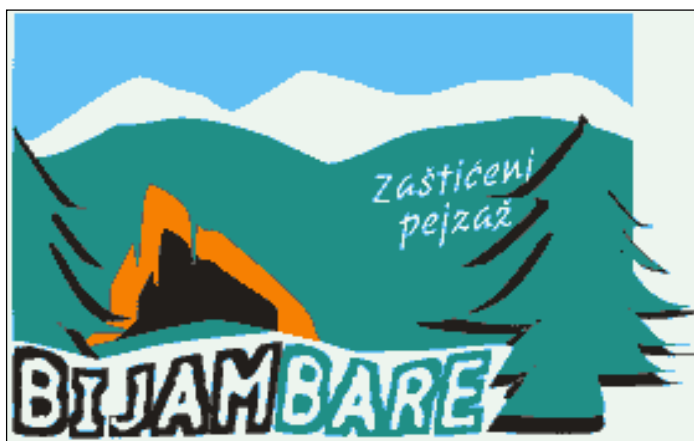
Slika 2. Logo zaštićenog područja «Bijambare»

Jedna od bitnih komponenti je i vizualni znak ovog područja koji je prikazan na slici 17. On se sastoji od stiliziranog crteža pećine i natpisa «Bijambare» koji će omogućiti da svi proizvodi iz ovog područja budu lako prepoznatljivi.