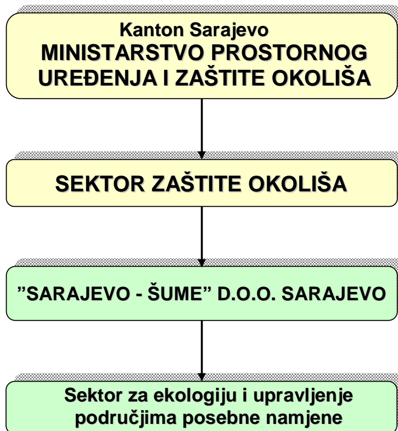
Grafikon 1. Institucionalni okvir za upravljanje

Finansiranje i svi drugi aspekti rada upravljačke institucije su regulirani posebnim aktima i sporazumima koje je Kantonalno ministarstvo za prostorno uređenje i zaštitu okoliša sklopilo sa upravljačem – Sarajevo-šume d.o.o. Sarajevo. Ovi sporazumi trebaju imati karakteristike dinamičnih dokumenata sa mogućnošću aneksnih dopuna shodno dinamici razvoja zaštićenog područja i potrebama Upravljača.